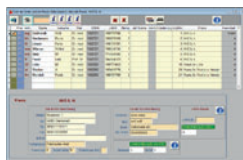
Ideal auch im MVZ für unbegrenzt viele Ärzte