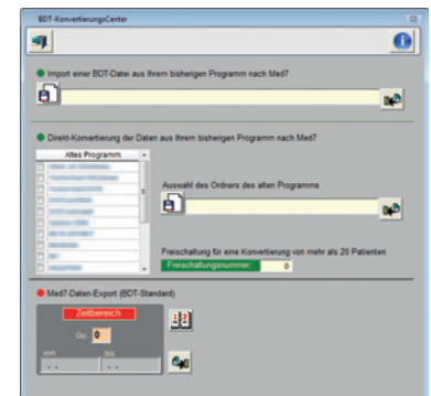
Der einfache Datenimport in Med7

Das in Med7 integrierte KonvertierungsCenter ermöglicht Ihnen eine sichere und umfangreiche Datenübernahme aus vielen bekannten Praxisprogrammen. Wählen Sie einfach aus einer Liste Ihr bisheriges Programm aus und schon werden die Daten all Ihrer Patienten (inkl. Behandlungsdaten, Word-Briefen, Bildern, Diagnosen etc.) ganz automatisch in nur wenigen Minuten in Med7 übernommen. Anschließend arbeiten Sie in Med7 weiter und lernen schnell alle neuen Funktionen kennen. Machen Sie jetzt eine kostenlose Probekonvertierung und überzeugen Sie sich selbst! War die Probekonvertierung erfolgreich, so können Sie gegen eine geringe Gebühr die gesamte Datenübernahme durchführen. Ein Datenimport über die BDT-Schnittstelle ist in Med7 zudem jederzeit kostenfrei möglich.